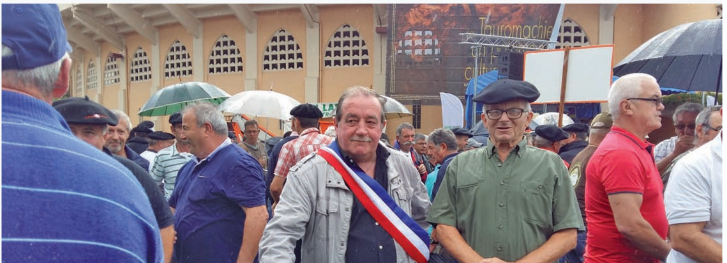
Manifestation à Mont de Marsan, Défense des chasses traditionnelles, de la ruralité et nos racines.