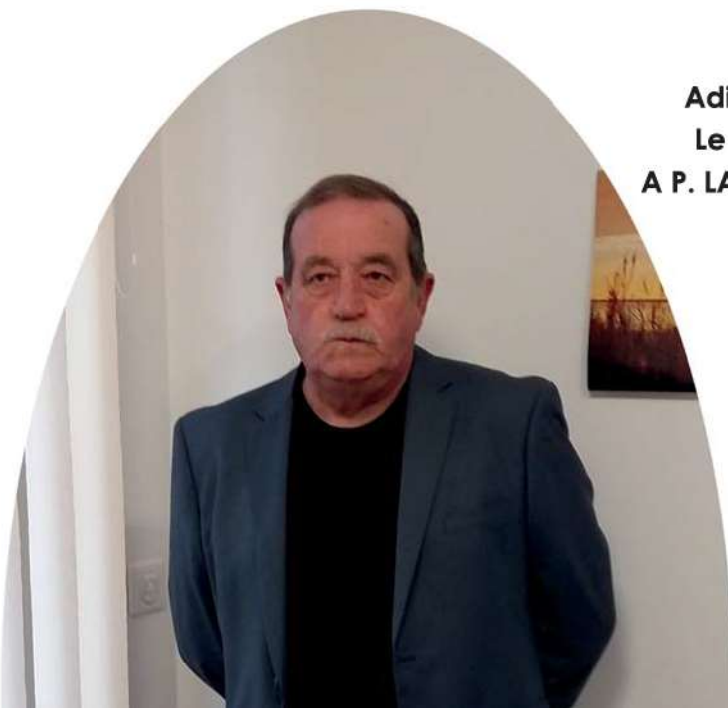
Adischatz Le Maire. A P. LAVIELLE

En attendant les lendemains qui chantent, je vous souhaite à chacune, chacun d'entre vous mes meilleurs vœux pour cette année 2019.