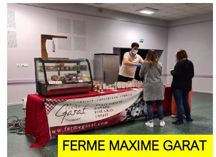
FERME MAXIME GARAT