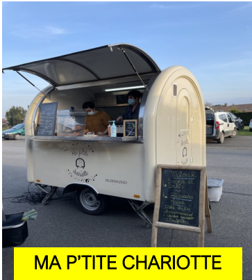
MA P'TITE CHARIOTTE

Après avoir lancé le dépôt-vente des producteurs le 11 novembre dernier, jour de la fête patronale, le marché de Saint Martin de Hinx est ouvert depuis le mois de janvier. Il se tient pour l'instant tous les vendredis de 15h30 à 18h45, suivant les contraintes sanitaires imposées ; il propose à la vente toute un échantillon de produits du terroir ou locaux, et les producteurs sont à disposition de tous pour vous offrir des produits de qualité.