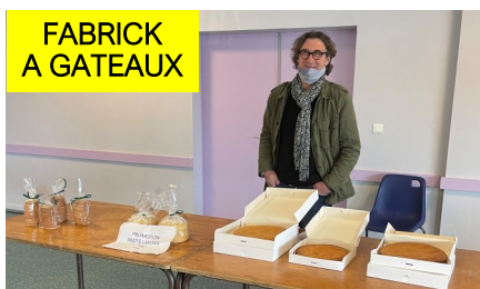
FABRICK A GATEAUX