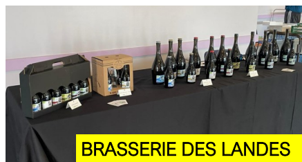
BRASSERIE DES LANDES