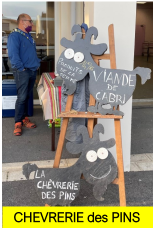
CHEVRERIE des PINS