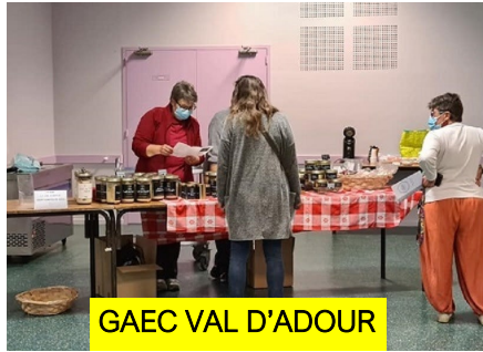
GAEC VAL D'ADOUR