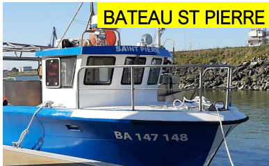
BATEAU ST PIERRE