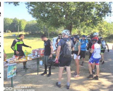
Le SMBS VTT RANDO